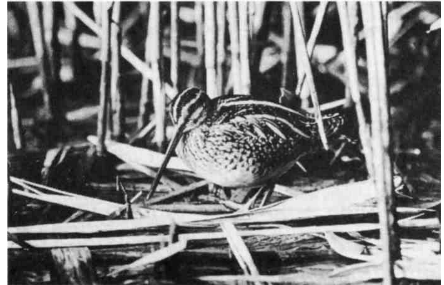
Für die Bekassine, einen seltenen und stark bedrohten Schnepfenvogel, ist die Moorlandschaft am Pfäffikersee das bedeutendste Brutgebiet der Schweiz.