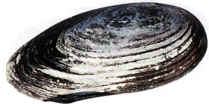
Abb. 1: Linke Schalenklappe einer Teichmuschel Anodonta cygnea aus dem Pfäffikersee. Die Muschel wurde etwa sechs Jahre alt.

Die laufende Untersuchung im Pfäffikersee ergab bisher drei Najadenarten, von denen aber bisher nur noch eine lebend angetroffen wurde: Grosse Teichmuschel, Anodonta cygnea (L.1758), (Abb. 1). Diese Art ist vorwiegend in tiefen Lagen im ganzen Mittelland zu finden und lebt auch im Pfäffikersee. Sie bewohnt die Weichsedimente (Schlamm, Silt, Feinsand) stehender und langsamfliessender Gewässer. In der Schweiz gilt sie als «noch nicht gefährdet» (TURNER et al. 1998).