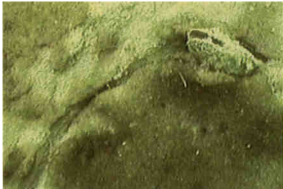
Abb. 4: Diese Teichmuschel zog bei ihrer Wanderung (nach rechts) eine Furche in den schlammigen Seeboden.