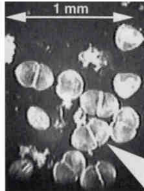
Abb. 5: Muschellarven (Glochidien) der Bachmuschel, mit geöffneten und geschlossenen Schalenklappen