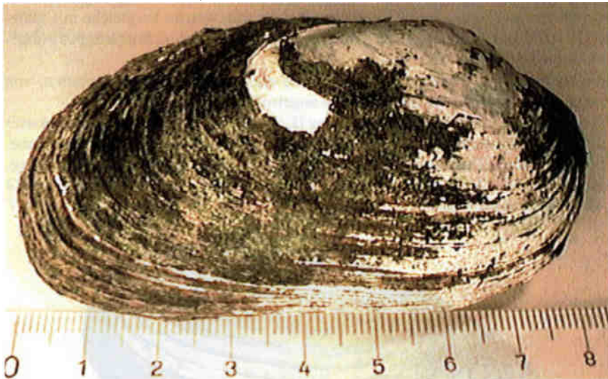
Abb. 2: Leere Schalen einer Bachmuschel Unio crassus aus dem Pfäffikersee. Die Muschel wurde mehr als 10 Jahre alt. Die leere Schale lag dann wohl während Jahrzehnten am Seegrund.

Bachmuschel Unio crassus . PHILIPSSON 1788. Eine einzige leere Schale einer Bachmuschel wurde gefunden (Abb. 2), ein Beweis dafür, dass sie einst im Pfäffikersee vorkam. Es ist aber unwahrscheinlich, dass die Art im See überlebt hat, denn sie bewohnt nur sehr saubere Gewässer; dafür ist der Pfäffikersee zu stark eutrophiert. Die einst häufige Bachmuschel ist heute in der Schweiz vom Aussterben bedroht (Rote Liste 1, TURNER et al. 1998).