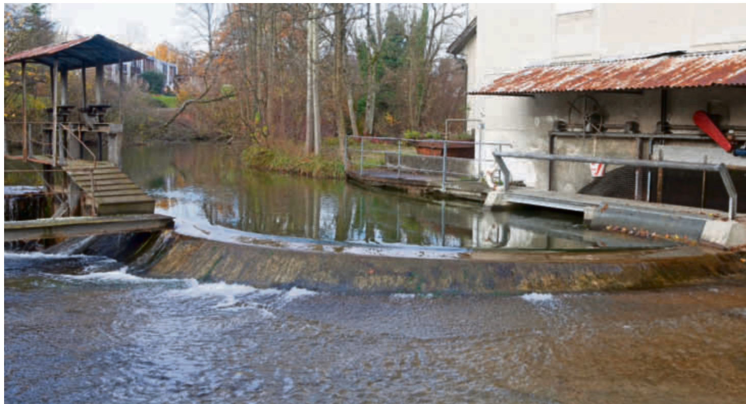
Im Wasserkraftwerk Schönau in Wetzikon sollen nach der Sanierung jährlich 315 000 kWh Strom produziert werden. Martin Bachmann, Denkmalpflege

Das bekannteste davon ist wohl das Kraftwerk Trümpler in